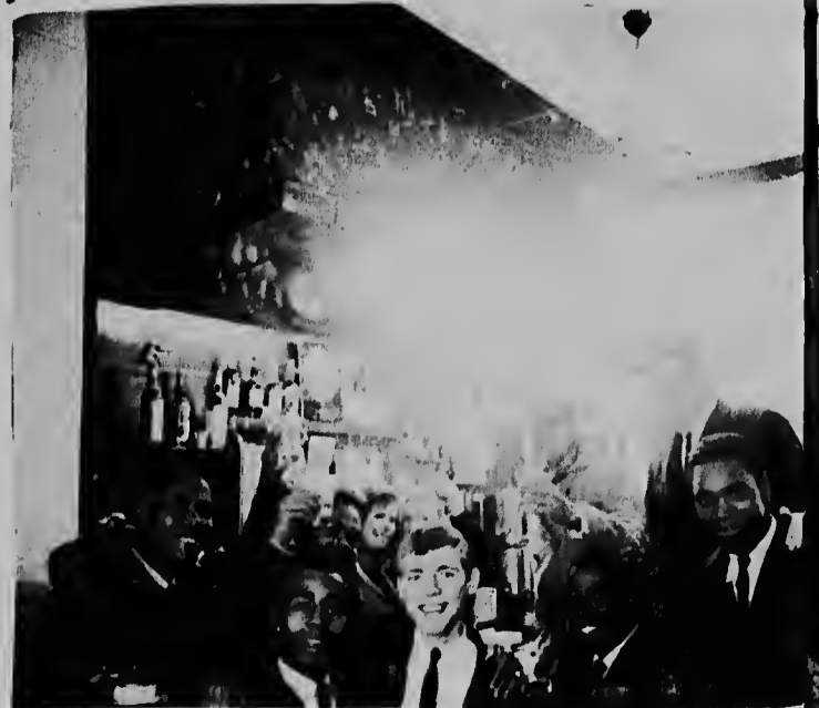
Den café "Rozendaal" tabatin un toost riba famia, amigunan na Corsow.